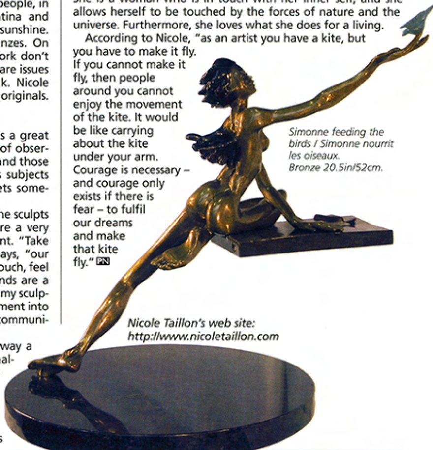
Simonne feeding the birds / Simonne nourrit les oiseaux. Bronze 20.5in/52cm.

Nicole Taillon's web site: http://www.nicoletaillon.com